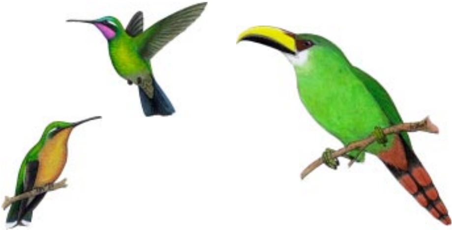
Colibrí Montañés Gorgipúrpura Lampornis calolaema