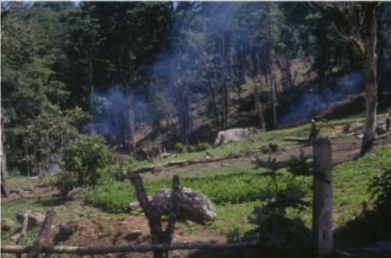
Deforestación en los bosques nubosos de la Reserva Natural Arenal, Departamento de Matagalpa.