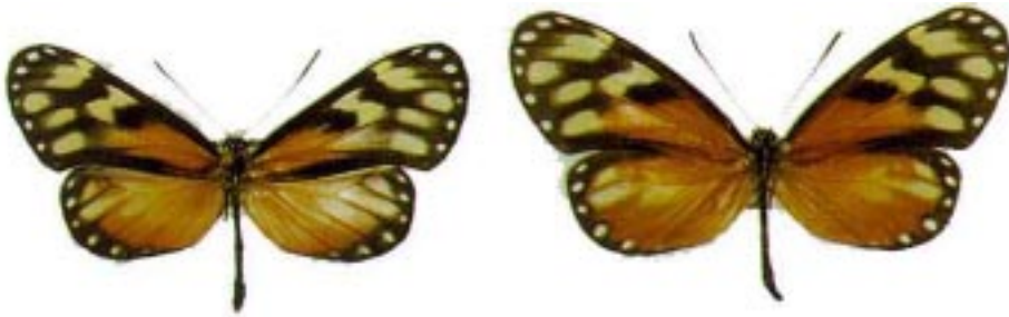
Napeogenes tolosa mombachoensis , mariposa endémica del Volcán Mombacho y las partes altas de las Sierras de Managua