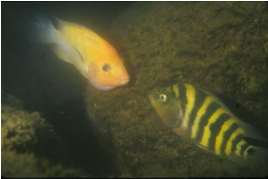
La población de Cichlasoma citrinellum en la Laguna de Xiloá puede estar constituida por más de una especie.