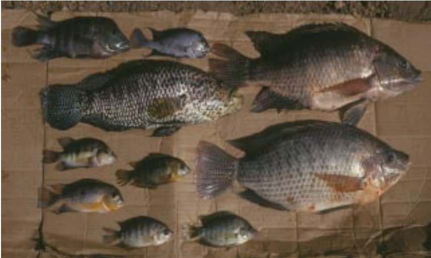
Una muestra de los Cíclidos de la Laguna Blanca (Departamento de Granada) y su comparación con una Tilapia introducida (al centro y con escamas oscuras).