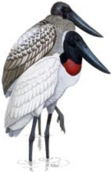
El Jabirú Jabiru mycteria , sólo se encuentra en humedales extensos y bien conservados. (Ilustración: A. Silva)