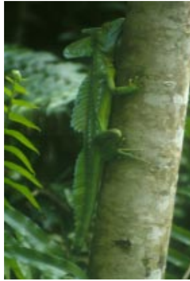
El Basilisco Basiliscus plumifrons , es muy perseguido para el comercio de mascotas.