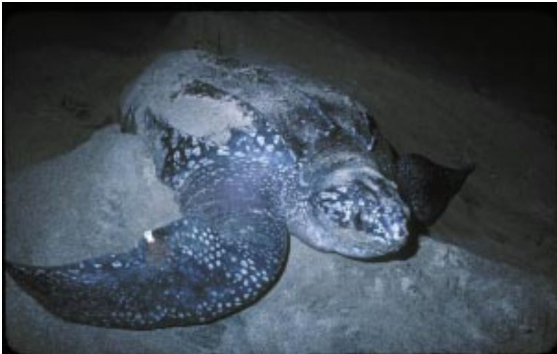
La Tortuga Tora Dermochelys coriacea está a punto de desaparecer de Nicaragua y de extinguirse a nivel mundial.