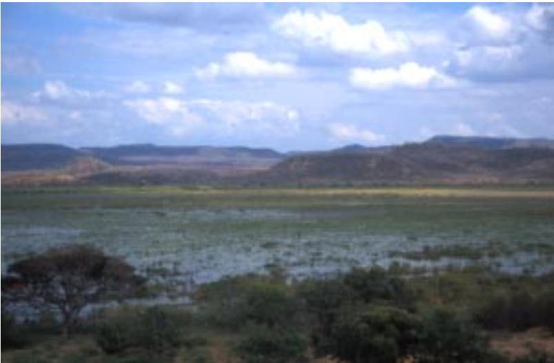
En la Laguna de Tecomapa, Dpto. de Matagalpa, se cazan miles de aves migratorias sin ningún control.