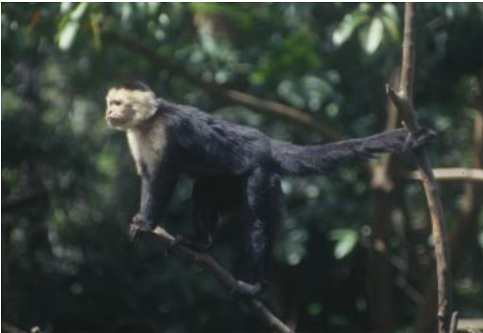
El Mono Cariblanco Cebus capucinus , una especie amenazada de extinción en las regiones Pacífica y Central del país.