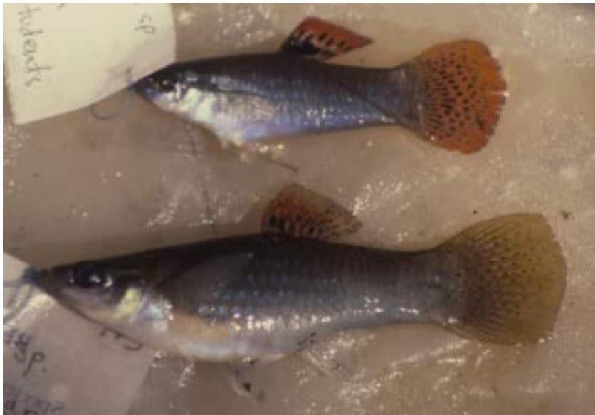
Poecilia sp. un pecesito no descrito y aparentemente endémico de la Laguna de Monte Galán.