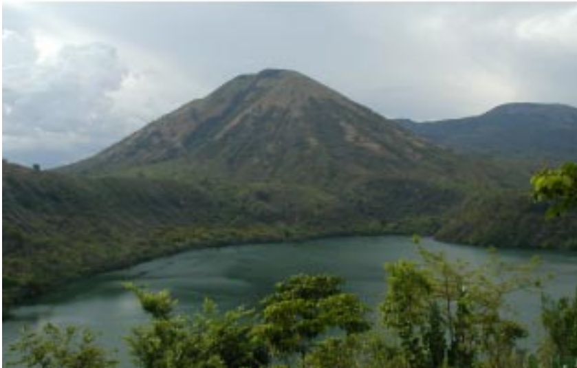
Laguna de Asoscosca en el Departamento de León