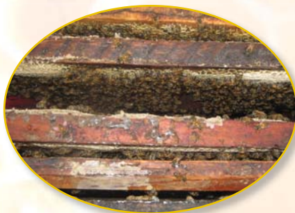
La correcta alimentación de las abejas en época de escases, generalmente entre los meses de mayo a octubre, mantiene la colonia en condiciones para aprovechar al máximo, los futuros flujos de néctar, en la época de cosecha.