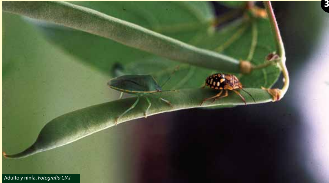
Adulto y ninfa.