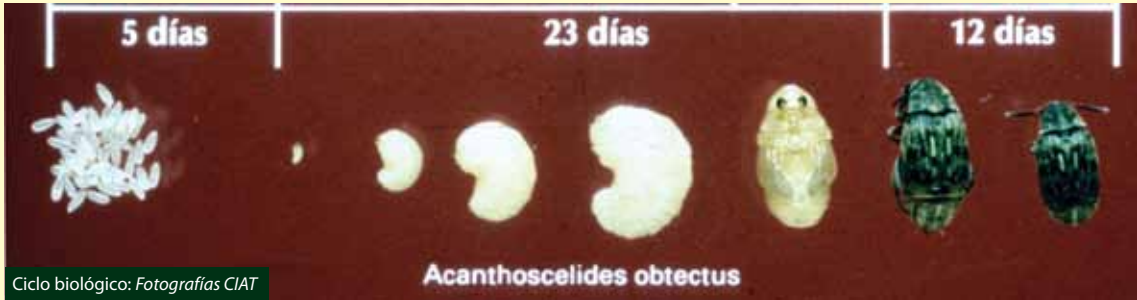
Ciclo biológico