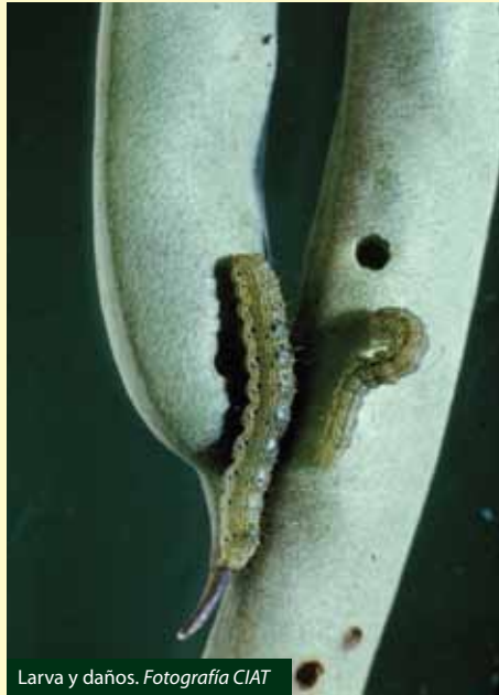
Larva y daños.