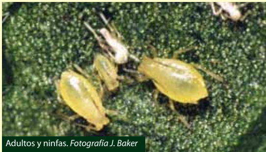
Adultos y ninfas.