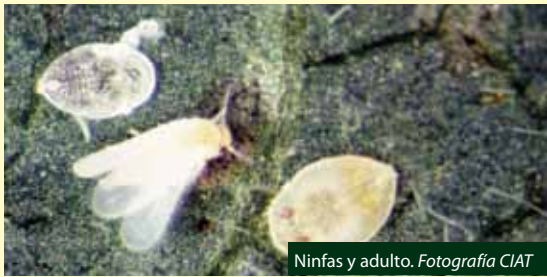
Ninfas y adulto.