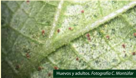
Huevos y adultos.