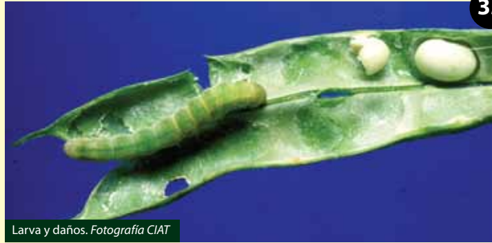
Larva y daños.