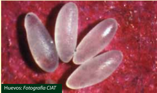
Huevos: Fotografía CIAT