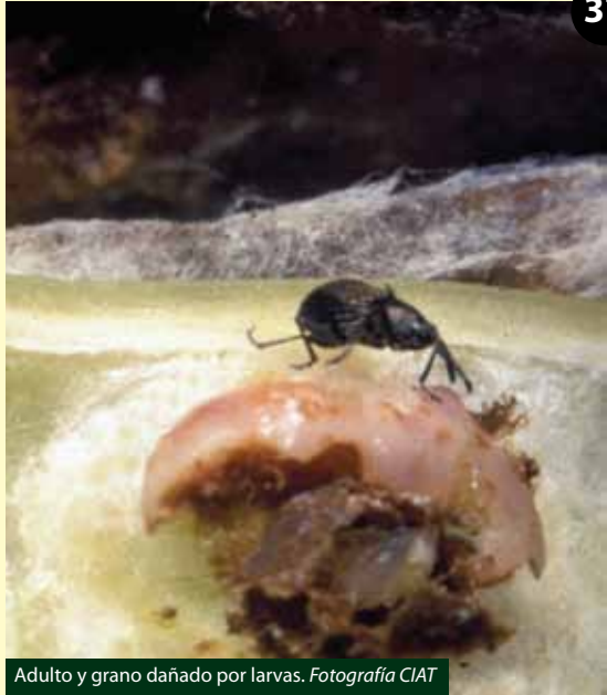
Adulto y grano dañado por larvas.