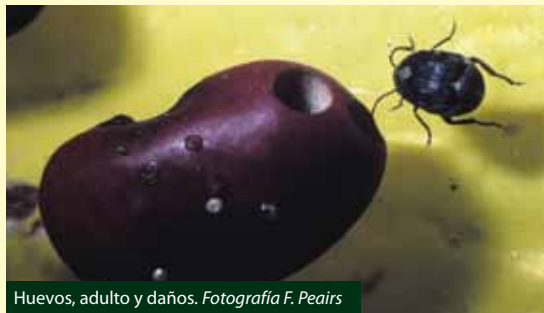
Huevos, adulto y daños.