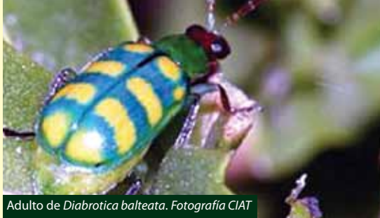
Adulto de Diabrotica balteata .