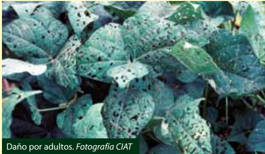
Daño por adultos.