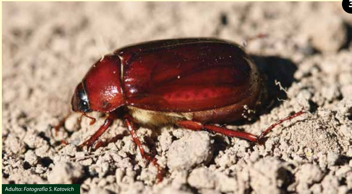
Adulto: Fotografía S. Katovich