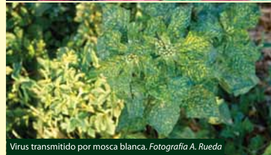
Virus transmitido por mosca blanca.