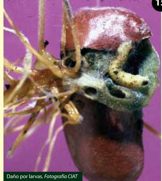
Daño por larvas.