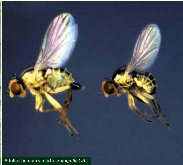
Adultos hembra y macho.