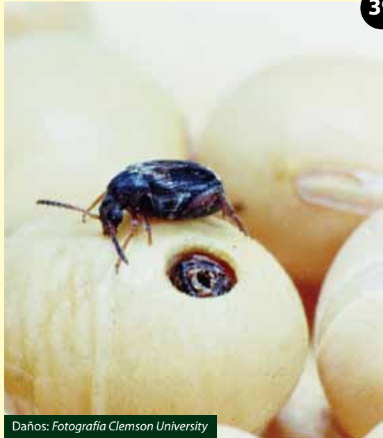
Daños: Fotografía Clemson University