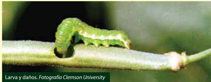
Larva y daños.