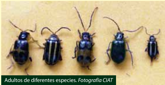
Adultos de diferentes especies.