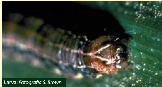
Larva: Fotografía S. Brown