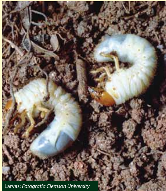
Larvas: Fotografía Clemson University