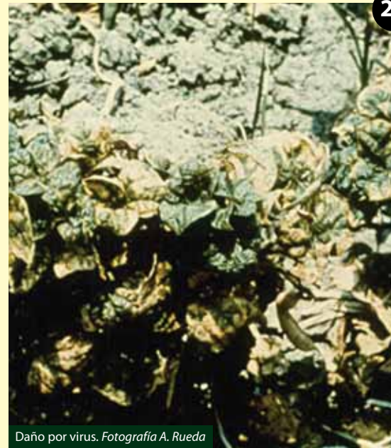
Daño por virus.