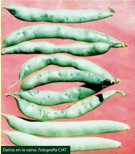
Daños en la vaina.