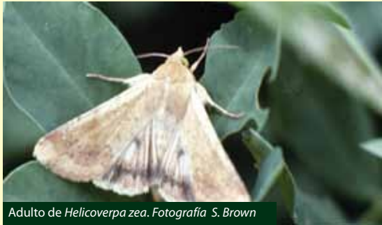
Adulto de Helicoverpa zea .