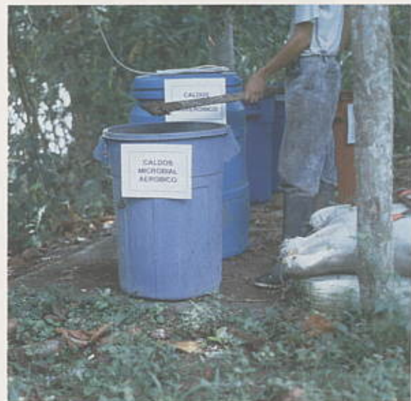
Producción de caldo microbial aeróbico.

Aeróbico: Es obtenido a partir de la fermentación aeróbica (o sea en presencia de oxígeno) de estiércol fresco de equino con agua natural, leche cruda y melaza. Para la preparación se recomienda utili-