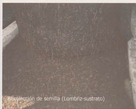
Recolección de semilla (Lombriz-sustrato)

Un kilogramo de lombrinaza por planta, le aporta al suelo 2.8 gramos de calcio y 1.0 de magnesio lo cual lo hace apto para ser aplicado en suelos ácidos, puesto que este compuesto tiene un grado de acidez de 7.9. Aporta al suelo 20 gramos de nitrógeno, 0.61 de fósforo, 2.02 de potasio y elementos menores de los cuales el más importante es el azufre 0.32 y el manganeso con 0.066 gramos.