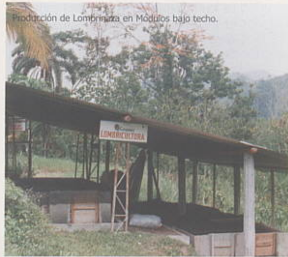
Producción de Lombrinaza en Módulos bajo techo.

El tamaño de los módulos depende de la disponibilidad de residuos orgánicos en la finca. Para mayor economía se recomienda construir tres módulos en uno, dos de 3 metros de largo, 1 metro de ancho y 0.70 metros de alto y otro en un extremo de 2 m. X 1 m. X 0.70 m de largo ancho y alto respectivamente. Alrededor del módulo se hace una zanja a 10 cm de profundidad, con el objeto de depositar aceite quemado o agua para evitar que las hormigas u otros enemigos de la lombriz penetren a los módulos.