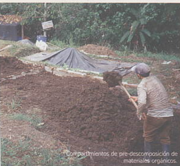
Compartimientos de pre-descomposición de materiales orgánicos.

En la parte externa y al aire libre, se recomienda construir cuatro compartimientos con madera, guadua, piedra o ladrillo con el fin de depositar y pre-descomponer el estiércol bovino y al mismo tiempo mezclar los materiales vegetales. En el primer compartimiento se deposita la bovinaza y se deja 15 días, durante este tiempo se moja constantemente para que escurran los ácidos, luego se traslada al segundo, tercer y cuarto compartimiento dejándolo ocho días en cada uno. A partir del segundo compartimiento se puede mezclar el material vegetal (cáscara de cacao, plátano y otros) bien picado para ser sometido a un proceso de pre-descomposición; es muy importante humedecerlo con frecuencia.