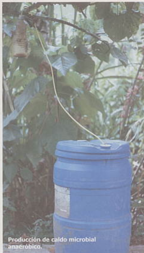
Producción de caldo microbioal anaeróbico.

Transcurridos 30 días, mediante filtrado se extrae el contenido líquido para ser utilizado como bioestimulante foliar o de suelo; el sustrato sólido restante puede ser utilizado como mulch.