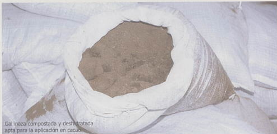
Gallinaza compostada y deshidratada apta para la aplicación en cacao.

Es un material, compuesto por las excretas de las gallinas, residuos de alimentos, plumas, huevos rotos y el material fibroso de la cama con cal; su composición química varía de acuerdo con la cantidad de estos compuestos y el tipo de explotación, dependiendo si es gallinaza de piso o de jaula.