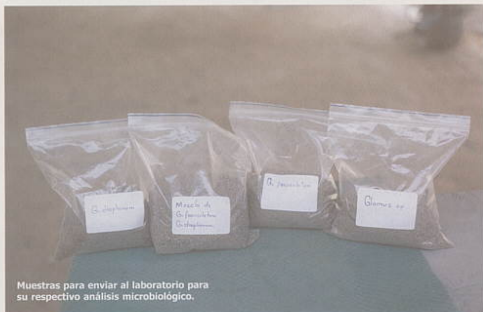
Muestras para enviar al laboratorio para su respectivo análisis microbiológico.

La muestra para el análisis microbiológico se toma de la rizósfera (suelo donde estén las raíces más finas) de árboles de cacao que se encuentren más vigorosos, sanos, libres de patógenos y en donde no se hayan aplicado productos químicos. Alrededor del árbol de cacao se toman varias sub-muestras de suelo y raicillas a una profundidad de 5 a 10 centímetros, hasta obtener 500 gramos de los cuales se envían 200 al laboratorio para su análisis, los 300 restantes se empacan en una bolsa plástica y se guarda en refrigeración, con el propósito de ser utilizado como inóculo de multiplicación según el resultado microbiológico.