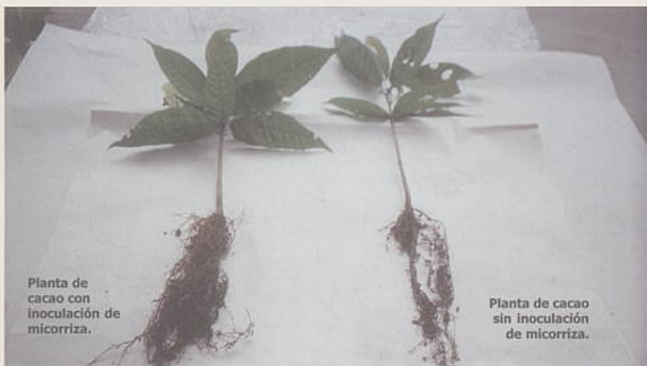
Planta de cacao con inoculación de micorriza.

Para la utilización de micorrizas en vivero de cacao se recomienda aplicar 20 gramos del inóculo por bolsa, después de 20 días de haber sembrado la semilla del patrón.