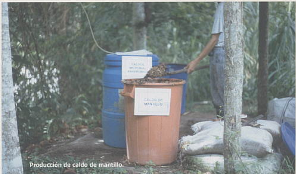
Producción de caldo de mantillo.