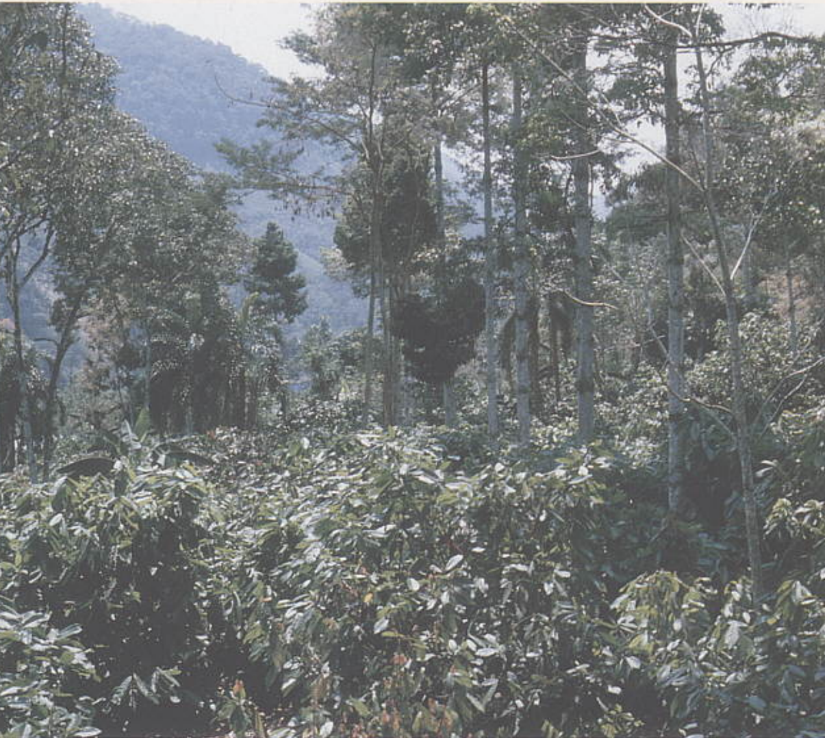
Aplicación de compuestos orgánicos en sistemas agroforestales con cacao.

Teléfono: 097-6345187 Fax: 097-6346717. E-mail: corpoica@cet.col.com