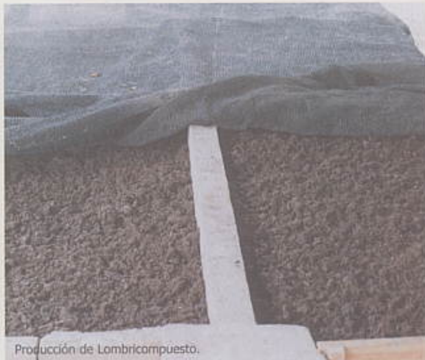
Producción de Lombricompuesto.

Abono orgánico, producto de la transformación de los materiales orgánicos biodegradables utilizados en la alimentación de la lombriz. Estos son ingeridos y convertidos en excretas enriquecidas que son expulsadas como deyecciones, las cuales se clasifican en función del tipo de alimento con el que se nutre a la lombriz.