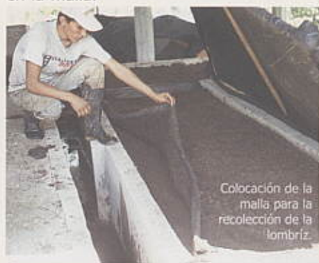
Colocación de la malla para la recolección de la lombriz.

lombrices y luego se procede a sacar el lombricompost hasta dejar vacío el módulo, quedando listo para reiniciar el proceso utilizando como semilla el material extraído en la malla.