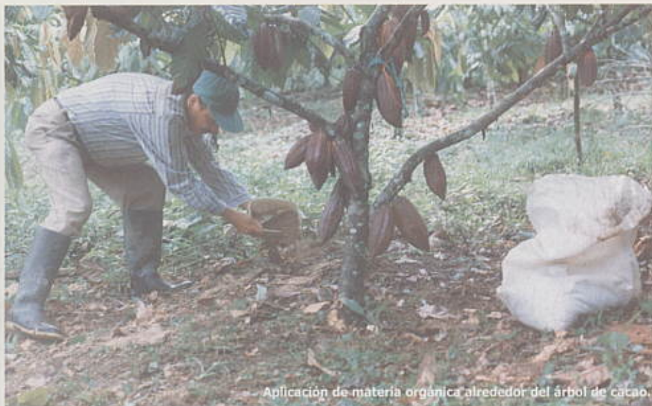
Aplicación de materia orgánica alrededor del árbol de cacao.

Después de obtener el abono orgánico se recomienda emplearlo en plantaciones cultivadas dentro del sistema agroforestal cacao, con el fin de aumentar el contenido de humus del suelo y su capacidad de retención de agua, mejorar su estabilidad estructural, facilitar el trabajo del suelo, estimular su actividad biológica y suministrar la mayor parte de elementos nutritivos necesarios para el desarrollo de las plantas.