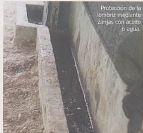
Protección de la lombriz mediante zanjas con aceite o agua.