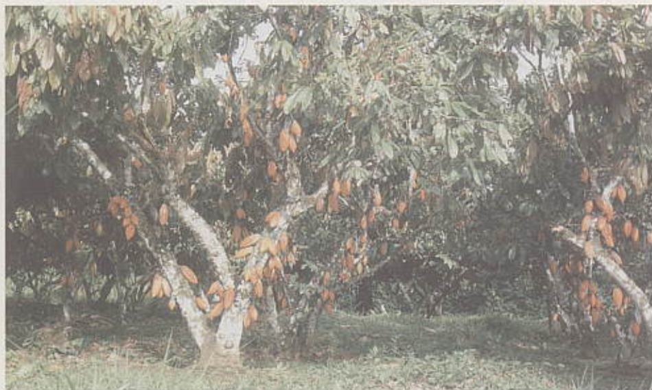
La aplicación continua de materia orgánica en cacao incrementa su producción.

Las prácticas utilizadas actualmente en la agricultura orgánica consisten en nutrir los micro y macroorganismos del suelo para que faciliten en las plantas la asimilación de los elementos esenciales para su desarrollo. El empleo continuo de materia orgánica durante el establecimiento y mantenimiento de las plantaciones de cacao, constituye la forma más eficiente para crear condiciones favorables en el desarrollo y multiplicación de los microorganismos; prácticas que mejoran la fertilidad del suelo y elevan su potencial productivo.