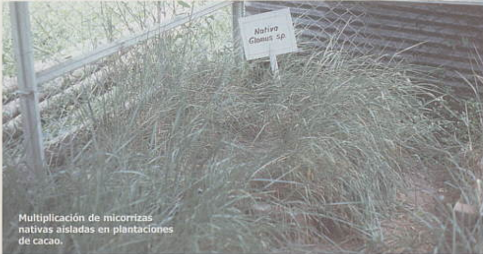
Multiplicación de micorrizas nativas aisladas en plantaciones de cacao.

A los cuatro meses se suspende el riego por espacio de 15 a 20 días con el fin de inducir la esporulación de las micorrizas; al azar, se seleccionan tres sitios por cajón y se prepara la muestra de suelo con raicillas para enviarla al laboratorio con el objeto de cuantificar la población de esporas y el porcentaje de colonización (superior al 40%) para decidir la utilización de este material como inóculo.