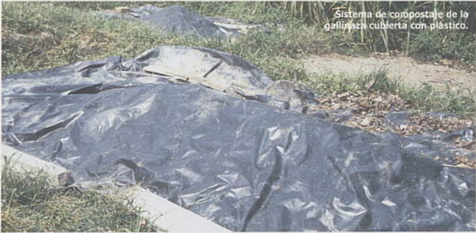
Sistema de compostaje de la gallinaza cubierta con plástico.

los microorganismos descompongan la materia orgánica y ponga a disposición los nutrientes. Así mismo, debe ser sometida a secado para almacenarla sin desencadenar procesos fermentativos, aumentando la concentración de materia orgánica y evitando el desarrollo de organismos perjudiciales para el cultivo de cacao. Después de seca la gallinaza debe ser tamizada y molida para homogenizar el producto, darle un tamaño uniforme a las partículas y aumentar la superficie de contacto con el suelo. El empaque y almacenamiento adecuados garantizan la conservación del producto cumpliendo con las características de calidad.