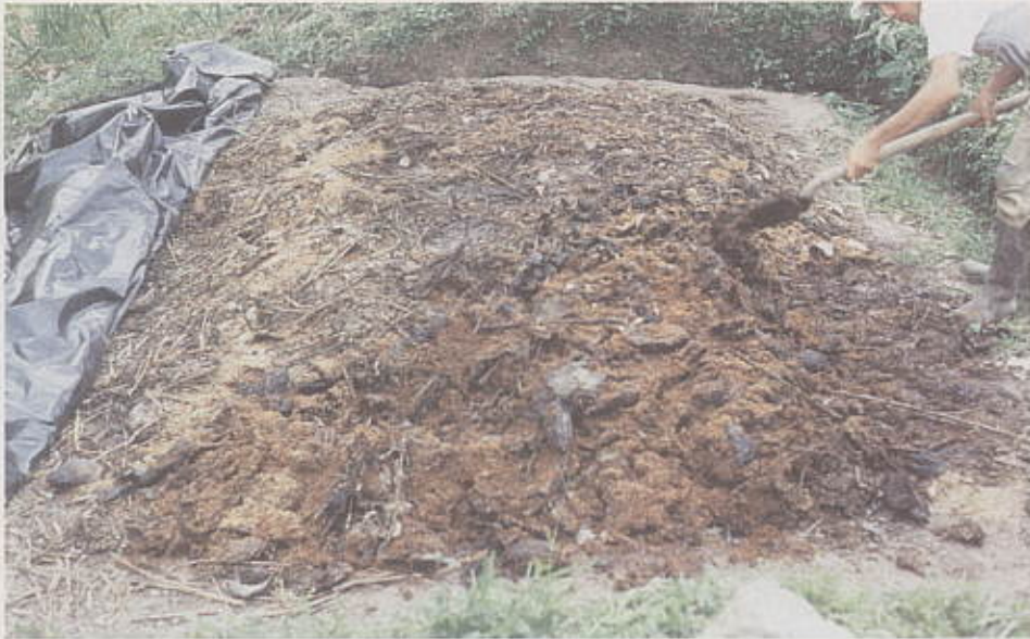
Los materiales utilizados en el Compostaje deben mezclarse cada 15 días.

Una vez realizada esta labor se coloca la primera capa de tierra oscura aproximadamente de 10 centímetros de espesor; se humedece y se coloca encima una capa de residuos vegetales frescos y picados, aproximadamente de 20 centímetros de espesor y luego se humedece. Posteriormente se coloca una capa de bovinaza, también de 20 centímetros de espesor y se espolvorea por encima la cal o la ceniza y se humedece.