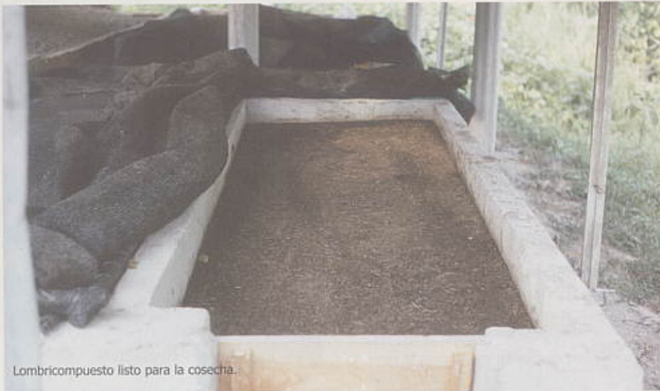
Lombricompuesto listo para la cosecha.

alimentar en los tres primeros días después de ser instaladas; durante estos días hacen sus propias galerías en el sustrato. A partir del tercer día se inicia la alimentación mediante el suministro del sustrato pre-descompuesto y con una humedad del 60%. Cada cuatro días se debe suministrar como alimento cantidades apropiadas de sustrato, dependiendo de la población de lombrices, del tamaño de los gránulos y del grado de descomposición del sustrato, hasta llenar la capacidad del módulo.