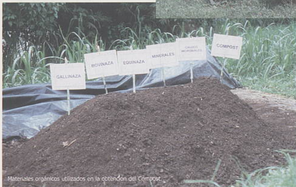
Materiales orgánicos utilizados en la obtención del Compost