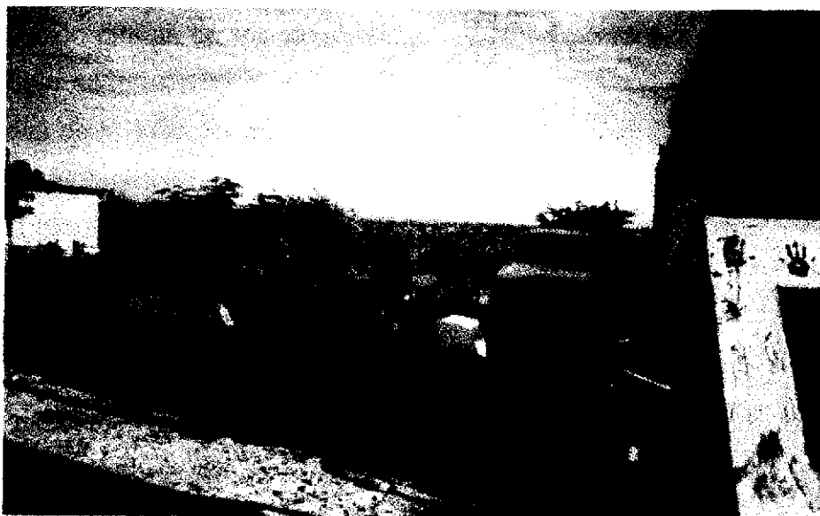
Figura 5. Participantes de la zona de amortiguamiento de Salinas Grandes, en el taller de consenso comunitario. León, 2002.

Con la última propuesta, se llegó al acuerdo de validarla, elaborarla y ejecutarla con la comunidad a partir del año 2003.