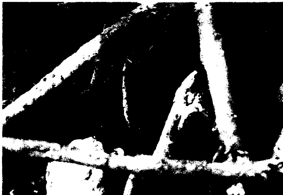
Figura 3. Area de manglar donde se extraen moluscos y crustáceos. Isla Juan Venado, León, 2002.

Los recolectores de moluscos y crustáceos trabajan de forma independiente, el producto extraído lo venden al final de la jornada a un intermediario que cuenta con infraestructura para su distribución en el mercado de León y, ocasionalmente, en Managua. Las larvas de camarón se venden a otro intermediario que las cultiva.