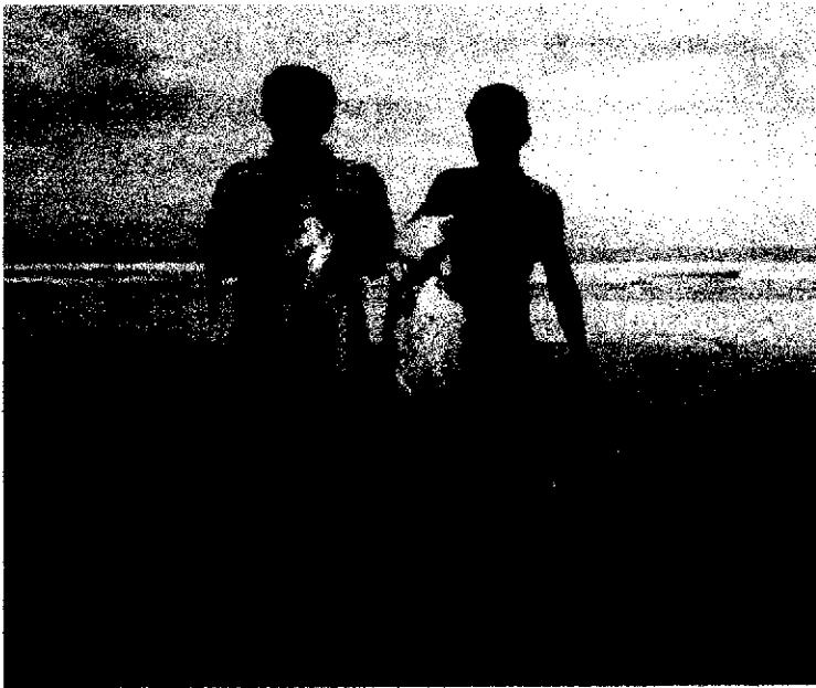
Figura 4. Jóvenes asalariados en actividades de pesca artesanal. Salinas Grandes, León, 2002.

Los dueños de lanchas emplean a pequeños grupos de pescadores, el producto de la pesca se vende posteriormente a intermediarios o directamente al mercado de León (Fig. 4). La actividad de comercialización la realizan las esposas de dueños de lanchas y otras mujeres de la comunidad. En general, los ingresos obtenidos de éstos recursos son bajos y temporales.