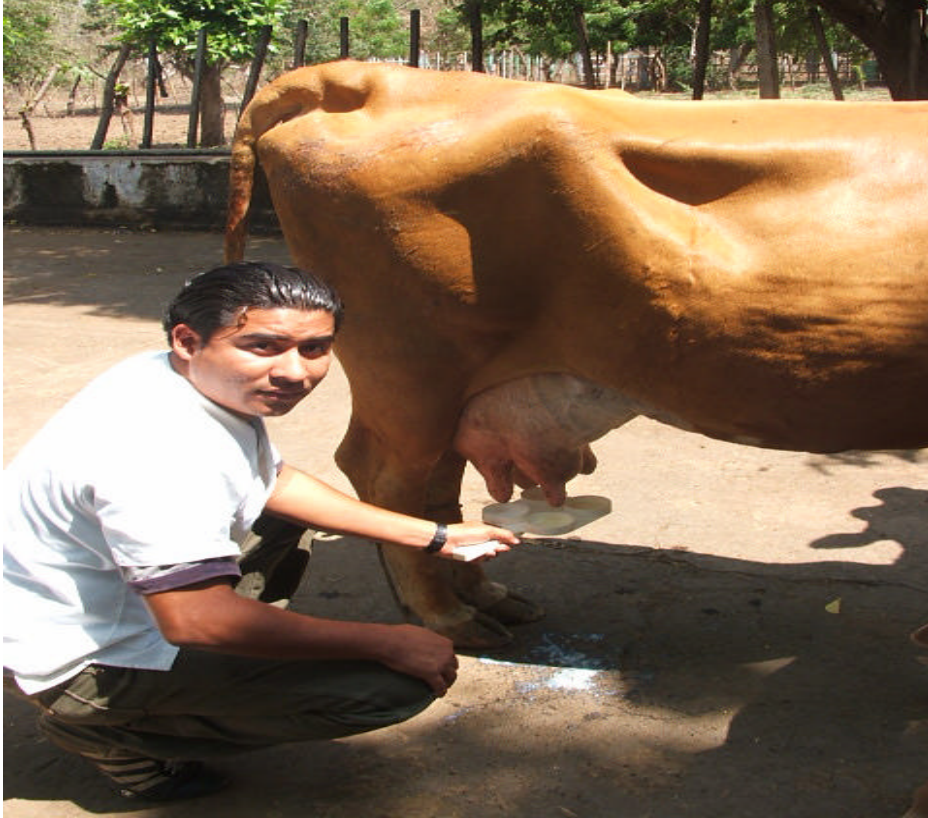
Foto. 1.- Recolección de leche de cada cuarto.