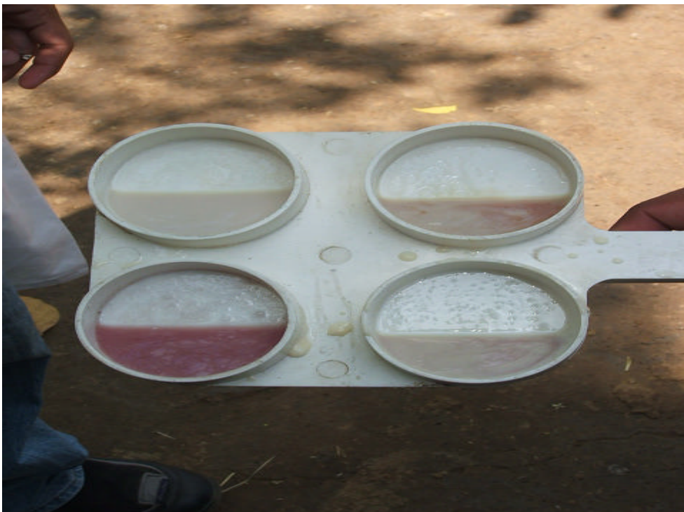
Foto. 4.- Presencia de coágulos gelatinosos.