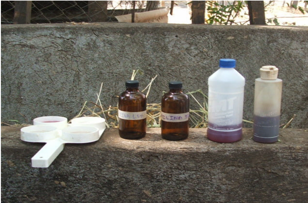
Foto. 5.- Materiales de uso frascos ámbar, reactivos de CMT, paleta de muestra