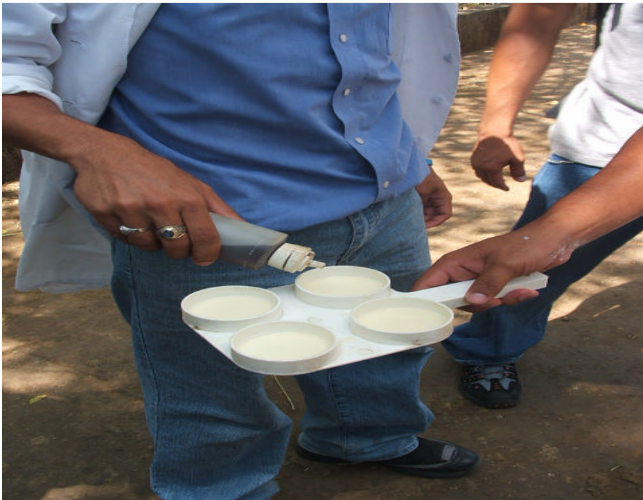
Foto. 2.- Dilución de la solución CMT con la leche