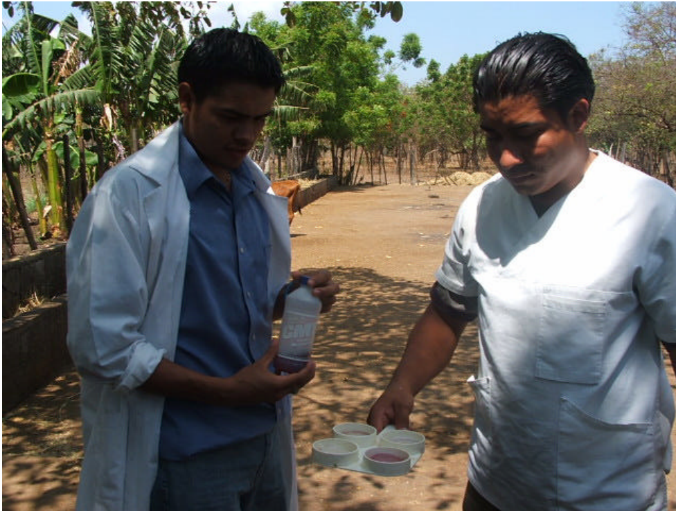
Foto. 3.- Movimientos en círculo por 20 seg. Para reacción antígeno-anticuerpo.