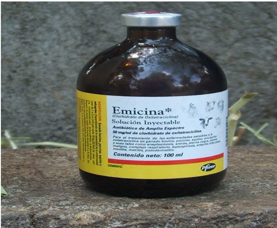
Foto. 6.- Medicamento que se utilizo como tratamiento testigo I. (oxitetraciclina).