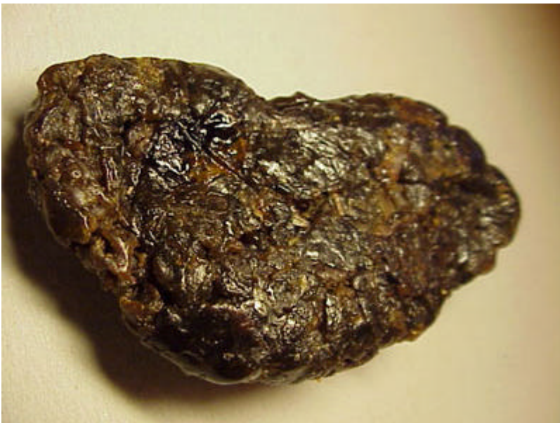
Fotografía 7: El Propóleos