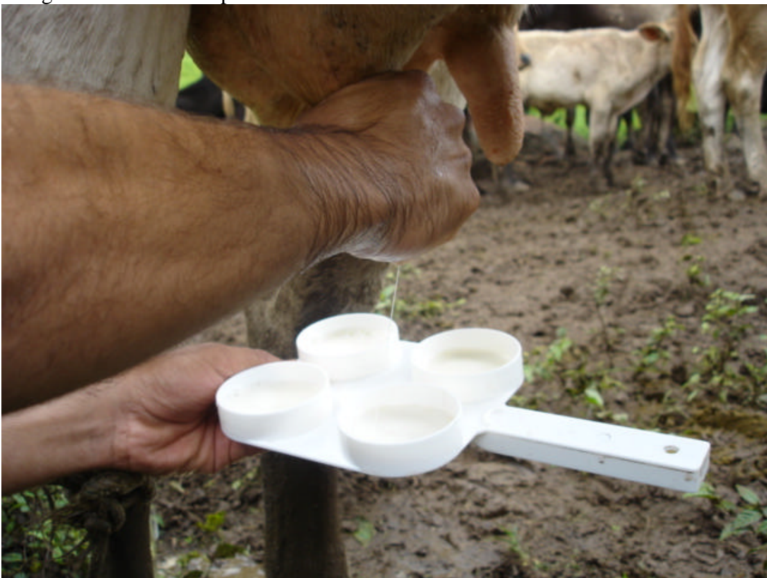
Fotografía 3: Toma de la muestra