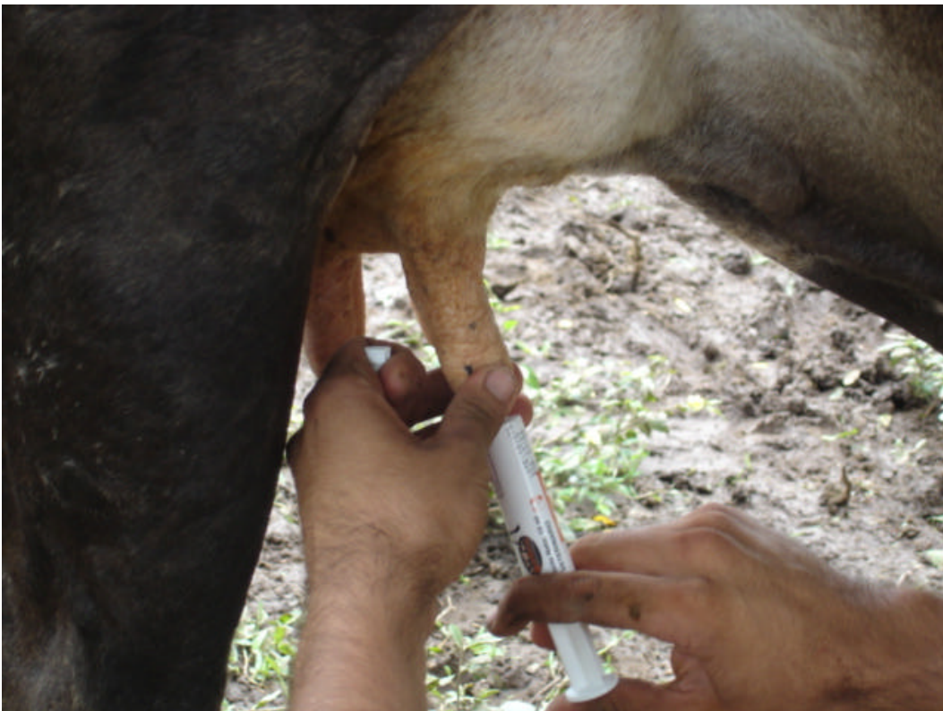
Fotografía 5: Aplicación del tratamiento testigo