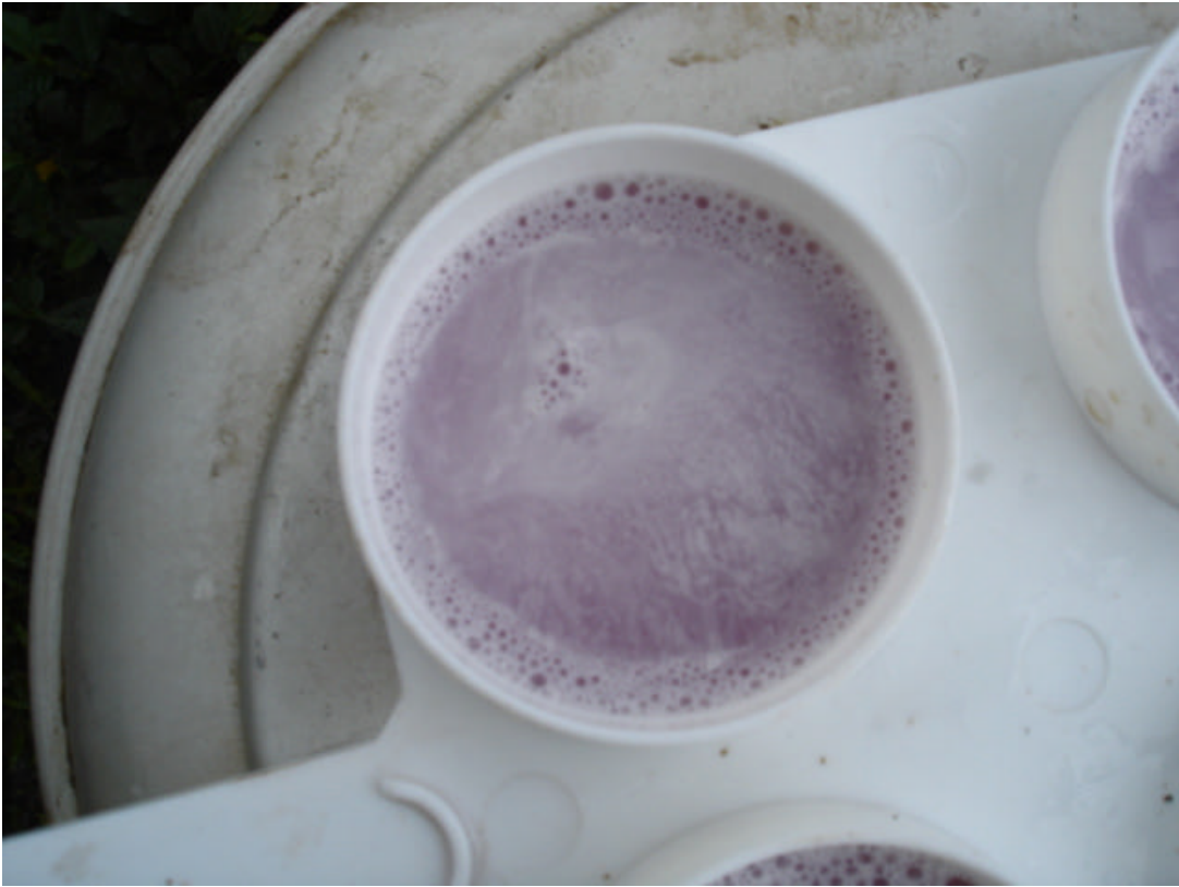
Fotografía 1: Leche mastitica