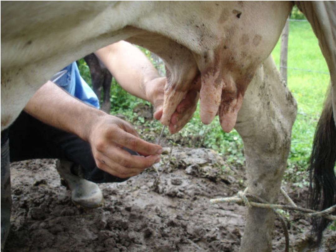
Fotografía 6: Aplicación de tratamientos alternativos