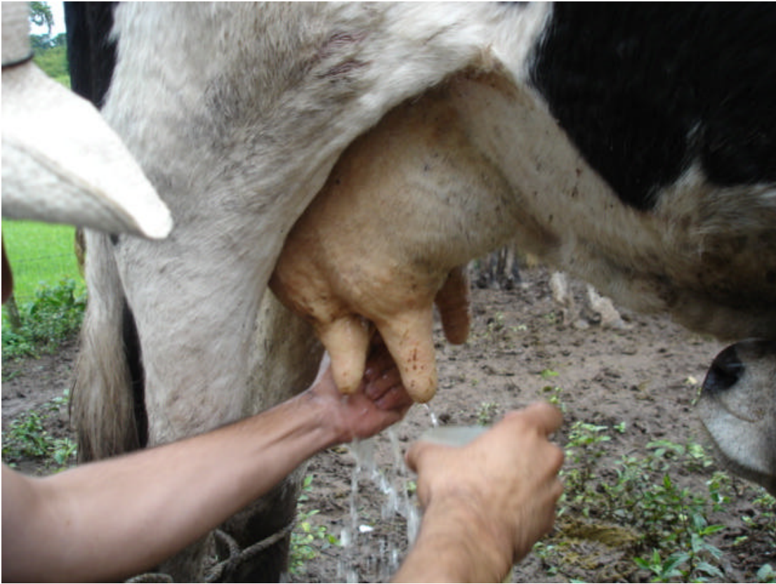
Fotografía 2: Lavado de pezones