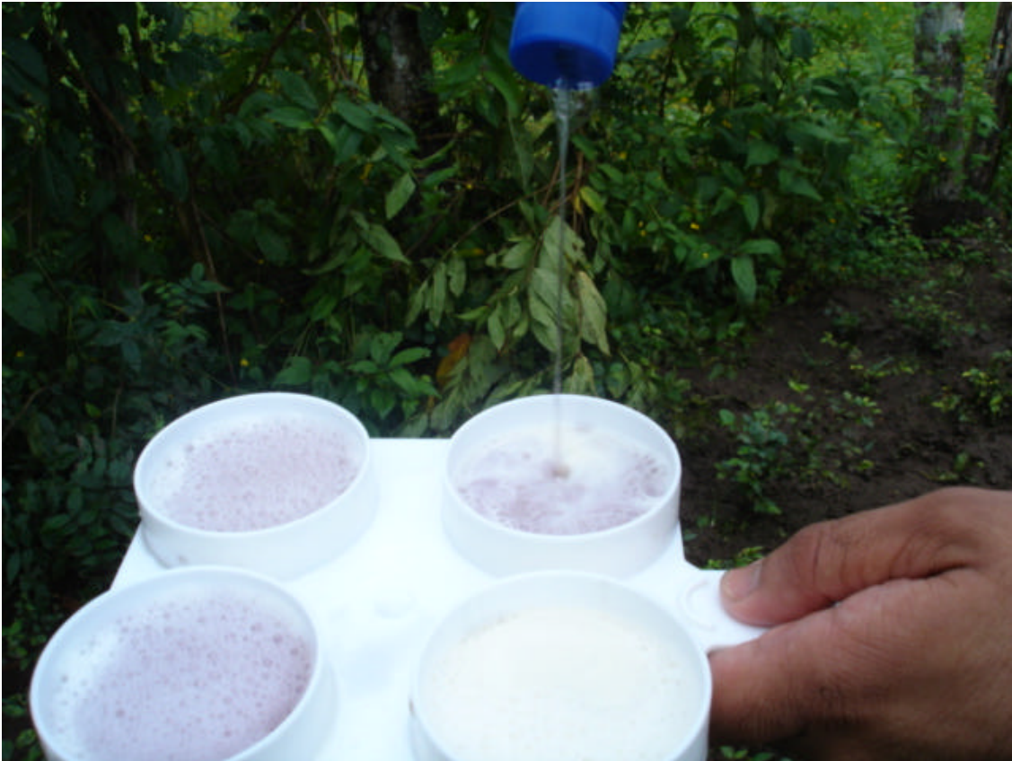
Fotografía 4: Adición del reactivo para prueba CMT