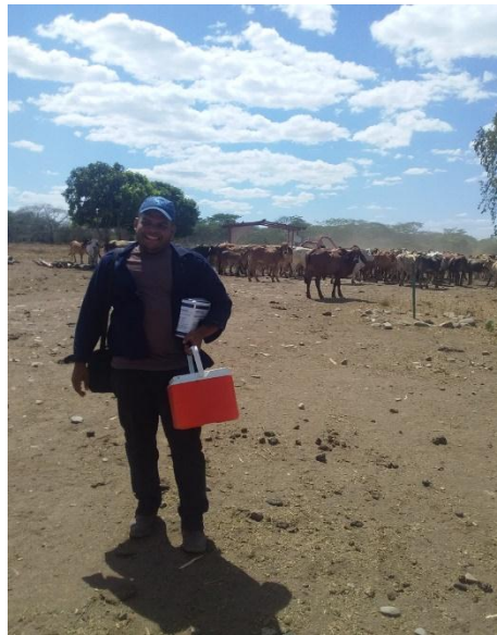
Anexo 2. Embarque de ganado bovino positivo a brucelosis, Finca Miramar, Nagarote, agosto 2020