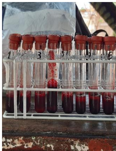
Anexo 16. Inspección a Finca ganadera La Ceiba, de La Paz Centro, abril 2020