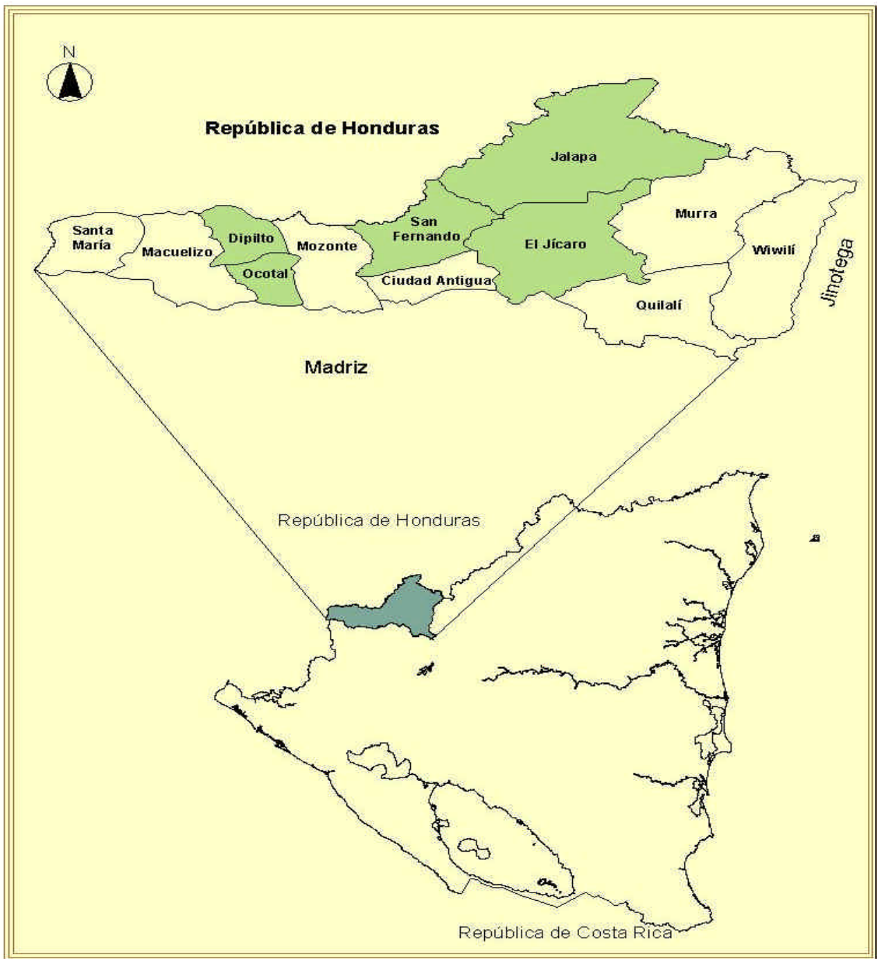
Fig. 5. Mapa de ubicación del departamento de Nueva Segovia y sus municipios, 2005