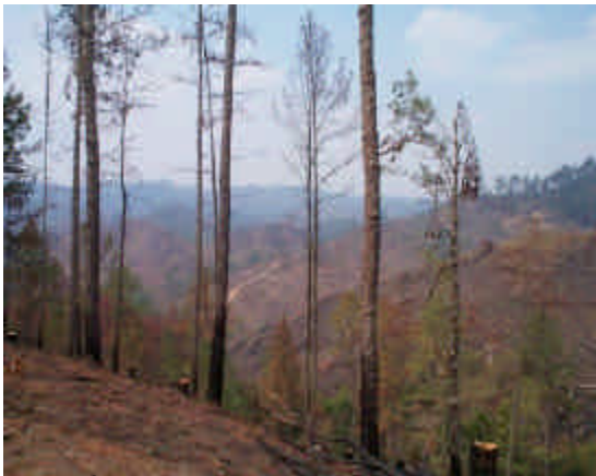
Fig. 3. Árboles atacados por D. frontalis Zimm. en Macaralí, Jalapa (Centro Humbolt, 2002).

Los descortezadores matan directamente a los árboles por daño y obstrucción de su sistema de conducción (Fig. 3), ya que las larvas se alimentan y viven en el tejido vivo debajo de la corteza (Fig. 4), la muerte de los árboles se acelera por la introducción de un complejo de hongos manchadores que se reproducen masivamente en el interior de las galerías (Romero, 2001, citado por Flores y Gutiérrez, 2002).