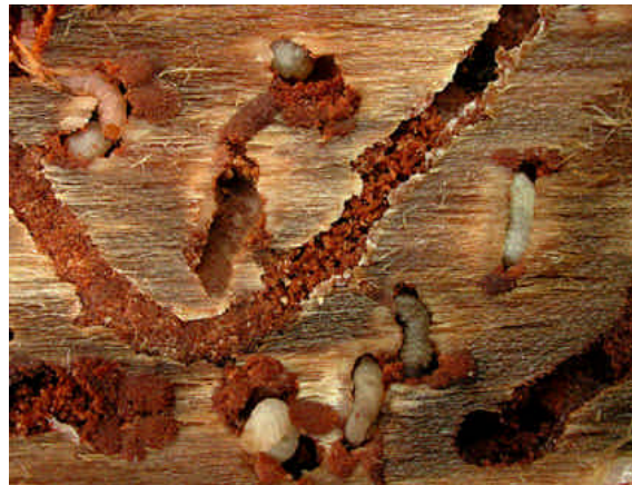
Fig. 4. Galerías de larvas de D. Frontalis Zimm. ( www.forestrymaques.org , 2004)