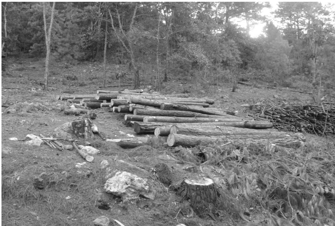
Figura 3. Madera en rollo comercial que permanece en el bosque. Reserva Natural Cerro Tomabú, Estelí, Nicaragua. 2009

Aun cuando la madera comercial tenga un valor favorable, no se puede decir que es valor ganado, porque en algunas fincas la madera aun no había sido extraída por problemas de acceso y de recursos, la cual, con el paso del tiempo, se deteriora con la consecuente reducción de su valor (figura 3).