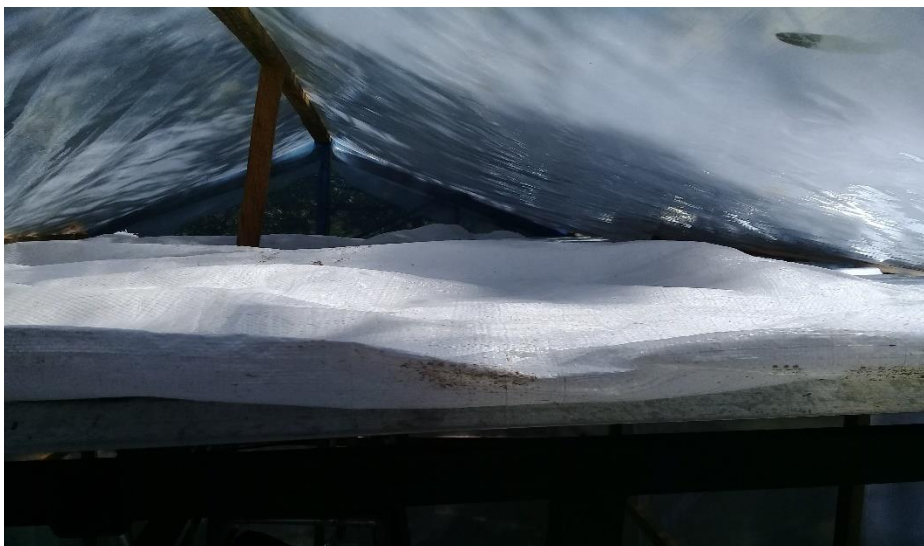
Figura 6. Cartón con sacos blanco para evitar los rayos solares directamente para FVH.