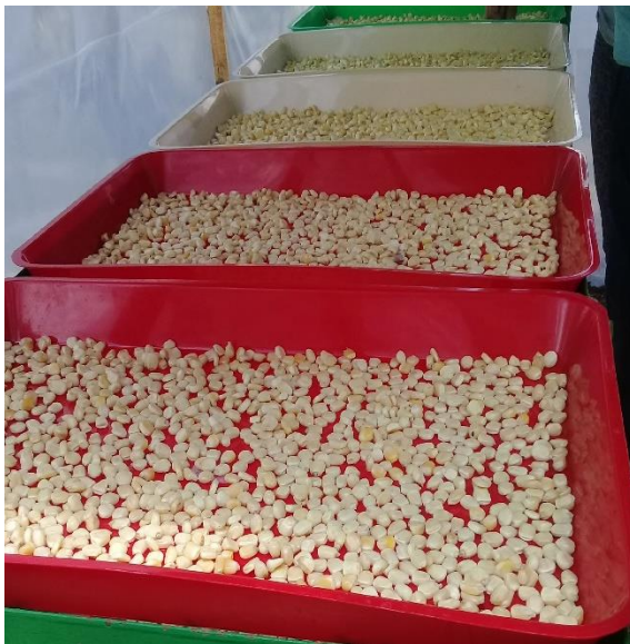
Anexo 6. Traslado de semilla a las bandejas.