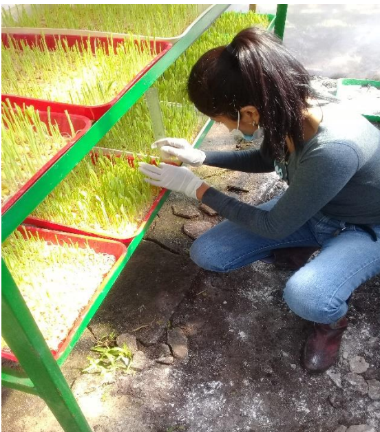
Anexo10. Toma de variable.