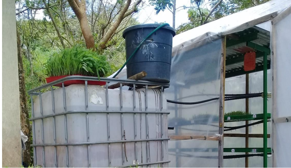
Figura 5. Sistema de riego para la producción de forraje.