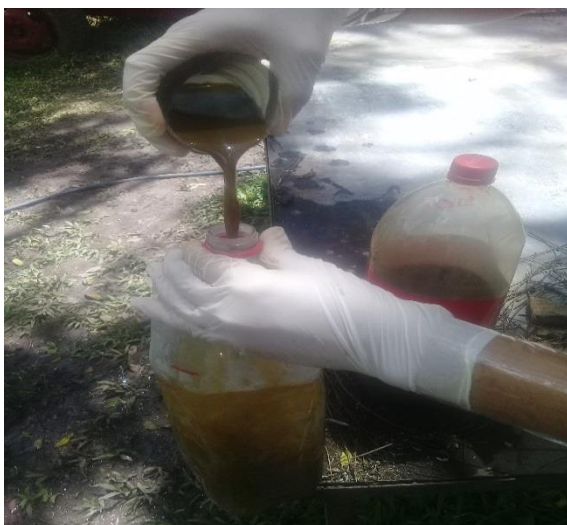
Anexo 12. Disolución de fertilizante.