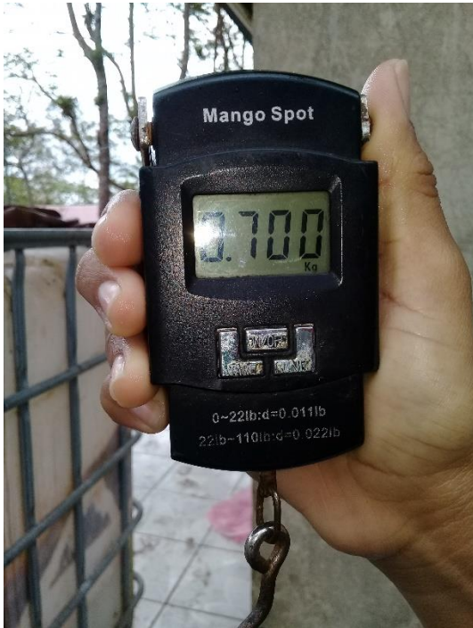
Anexo 4. Pesaje de semilla