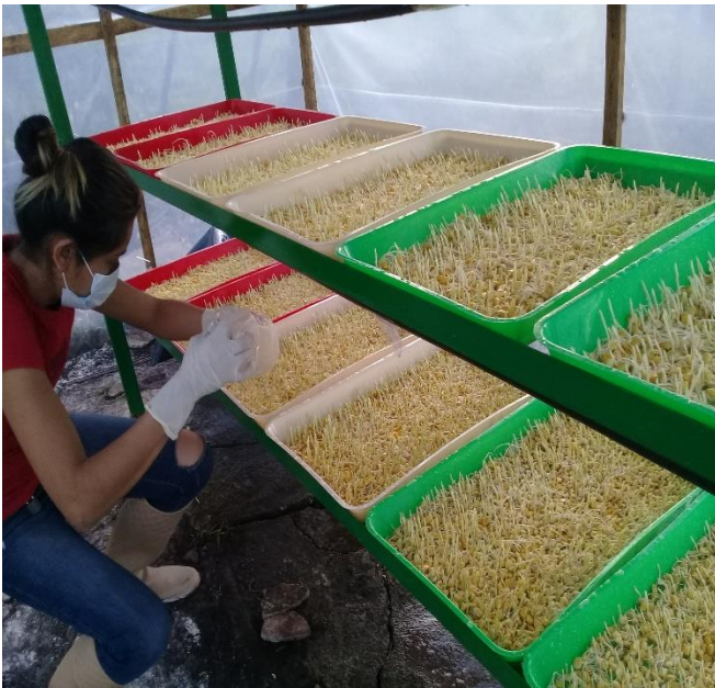
Anexo 8. Segundo día de pregerminacion y aplicación de cal.