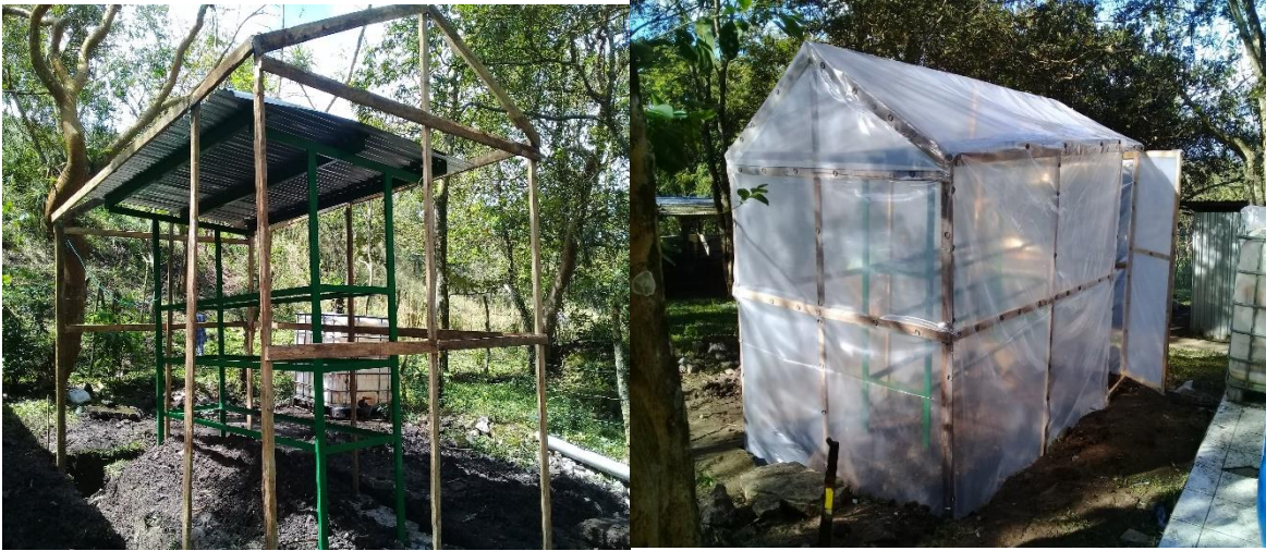
Figura 7. Infraestructura para la producción de FVH en Centro de Prácticas San Isidro Labrador de la UNA Camoapa.