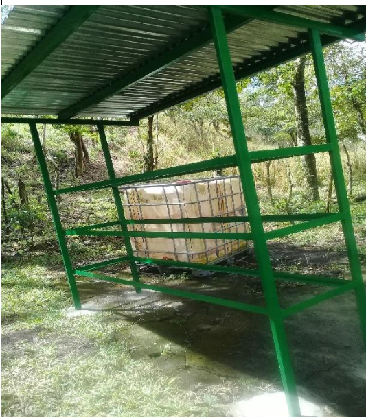
Anexo 1. Andamio para FVH.