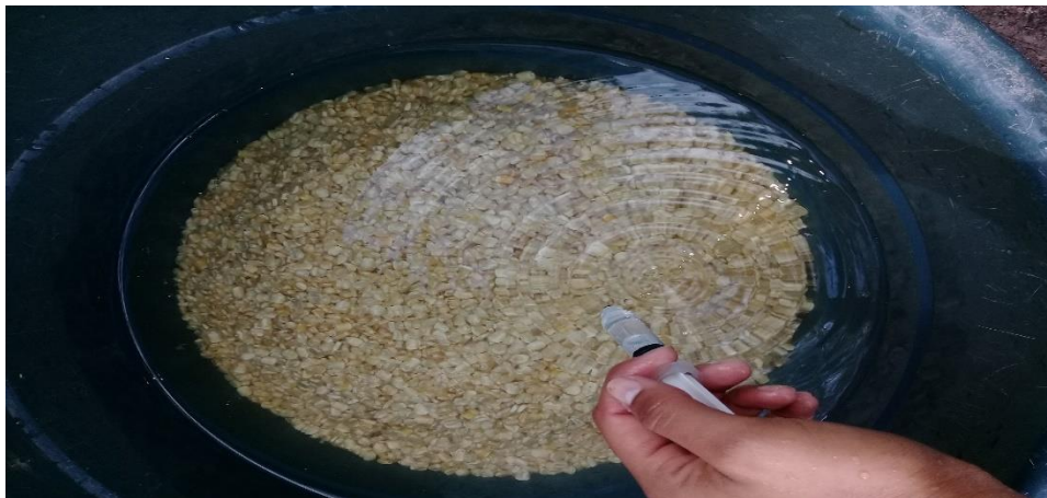
Figura 2. Lavado y desinfectado del maíz.

Las semillas se sumergieron en una tina plástica con capacidad de 60 litros de agua con un 2% de hipoclorito de sodio durante 15 minutos; el objetivo de este lavado fue eliminar los ataques de microorganismos patógenos al cultivo de FVH como hongos y bacterias. Después de este período se drenó de nuevo, se le dio un lavado rápido y se pasó a pre germinación.