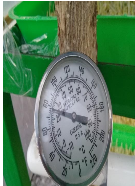
Anexo 9. Toma de temperatura.