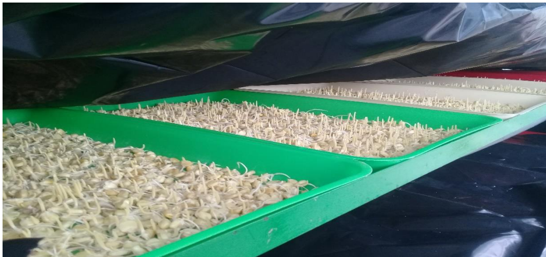
Figura 3. Área de germinación de semillas de maíz criollo.

La pre germinación nos asegura un crecimiento vigoroso del FVH porque induce la rápida germinación de la semilla. Después de haber sido tratada, la semilla se trasladó a otra tina con agua para humedecerla durante 24 horas; al cumplir 12 horas de este período se extrajo el agua con el objetivo de oxigenarla durante una hora evitar el ahogamiento del embrión, así como también para lograr una completa imbibición de las semillas; las próximas 12 horas se repite el procedimiento. Este proceso de humedecimiento debe ocurrir en recipientes debidamente cubiertos para mantener una humedad ambiental alta dentro de los mismos.