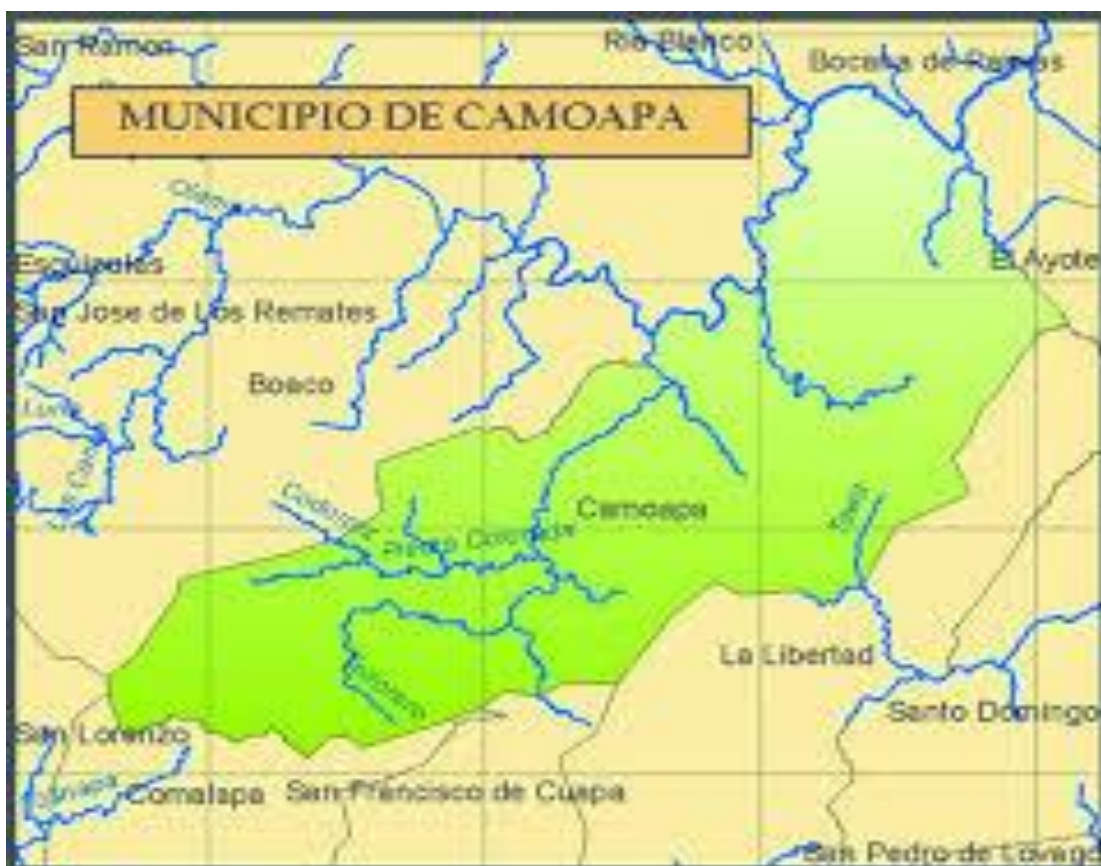
Figura 1. Mapa del municipio de Camoapa.

El municipio de Camoapa del departamento de Boaco, dista a 115 km de Managua, capital de la república. Con una altitud aproximada de 520 m.s.n.m. Se localiza en la posición geográfica de latitud 12°22'48"N y longitud: 85°30'36" oeste. La precipitación pluvial alcanza desde los 1,200 hasta los 2,000 milímetros al año, con una extensión territorial de 1.483,29 km 2 . Limita al norte con los municipios de Boaco, Matiguás (Matagalpa) y Paiwas (RAAS). Al sur con Cuapa y Comalapa. Al este con los municipios de El Ayote (RAAS) y La Libertad Chontales. Al oeste con los municipios de San Lorenzo y Boaco (Ortega y Duarte, 2016)