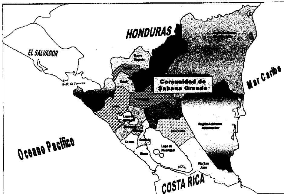
Figura 2. Mapa de la ubicación geográfica de la comunidad de Sabana Grande.

La comunidad de Sabana Grande se encuentra ubicada en la longitud O 86° 48' y latitud N 13° 76', y pertenece al municipio de Pueblo Nuevo, del departamento de Estelí. Encontrándose a unos 91 kilómetros de la cabecera departamental.