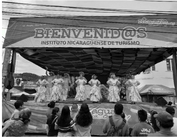
Anexo 10. Festival alegría victoriosa Carazo y Managua visitan Matagalpa.