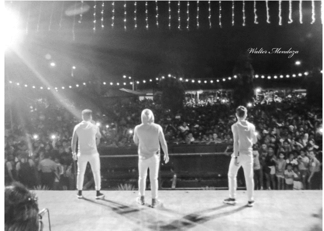
Anexo 14. Celebración de las victorias con la agrupación costa azul.