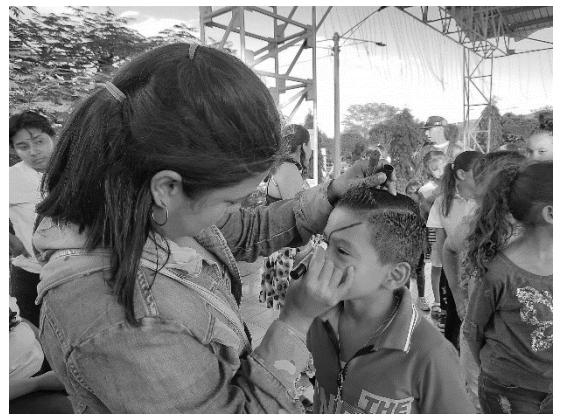
Anexo 16. Anexo 17: festival diciembre de alegría familiar y concurso de árboles a base de materiales reciclados.