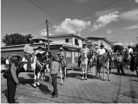
Anexo 3 . Cierre de desfile Hípicos 2022.