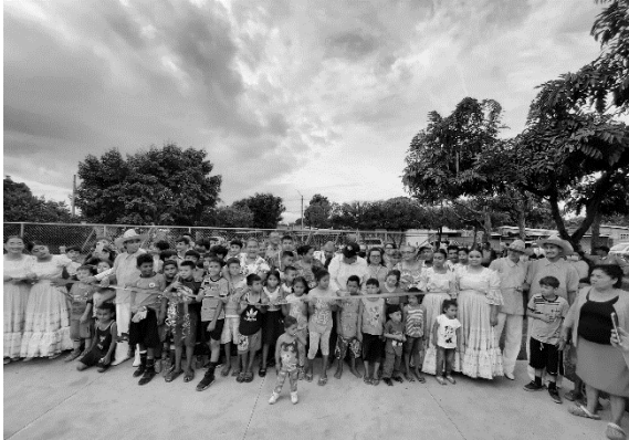
Anexo 8. Inauguración de proyecto de cancha multiuso.