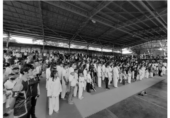
Anexo 4 11vo. Campeonato de Karate Do.