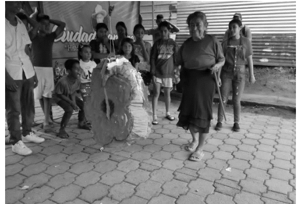
Anexo 7. Festival de alegría familiar.