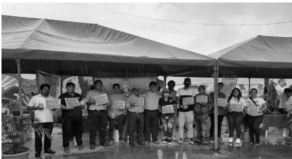
Anexo 6. Feria municipal en conmemoración al día Internacional del turismo.