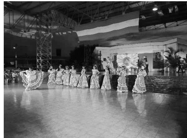
Anexo 12. Elecciones a belleza indígena