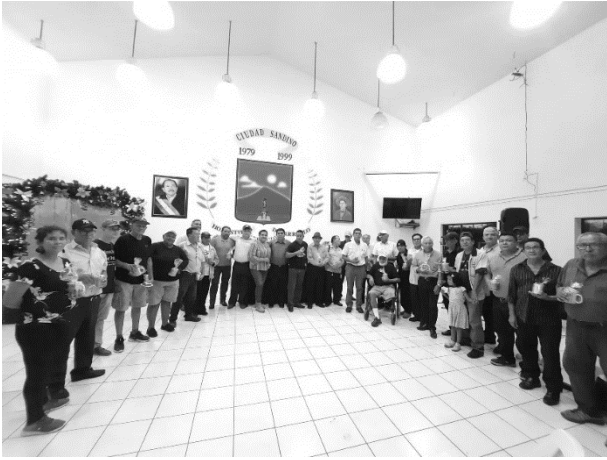
Anexo 15. Celebración al día del músico.