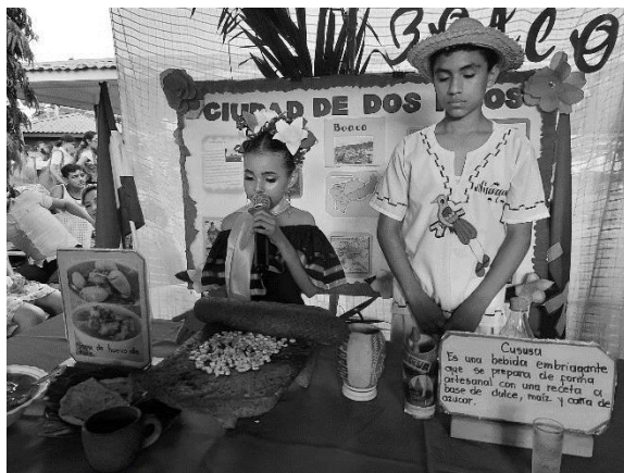
Anexo 11. Expo feria estudiantil conmemoración al día de la resistencia indígena.