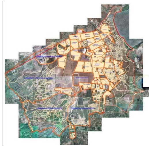
Figura 1. Mapa ciudad Sandino-Managua. Figura 2. Vista satelital ciudad Sandino.

Referencia: Alcisa, departamento de catastro.