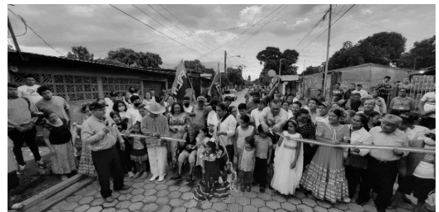
Anexo 5. Inauguración del proyecto revestimiento de Calles con adoquín.