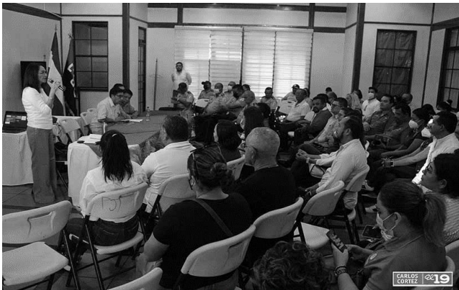
Anexo 17. Encuentro Anual de evaluación del año 2022, del sector turismo del departamento de Managua.