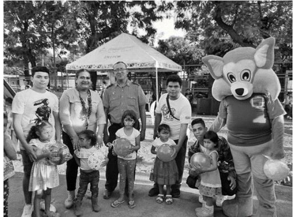
Anexo 18. Tarde de Reyes