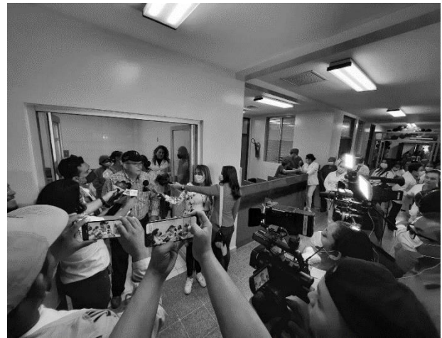
Anexo 9. Inauguración de mejoras en infraestructura de quirófano del centro oftalmológico Sandino del municipio de ciudad Sandino.