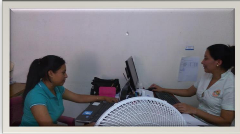
Foto 1. Revisión cuentas por cobrar