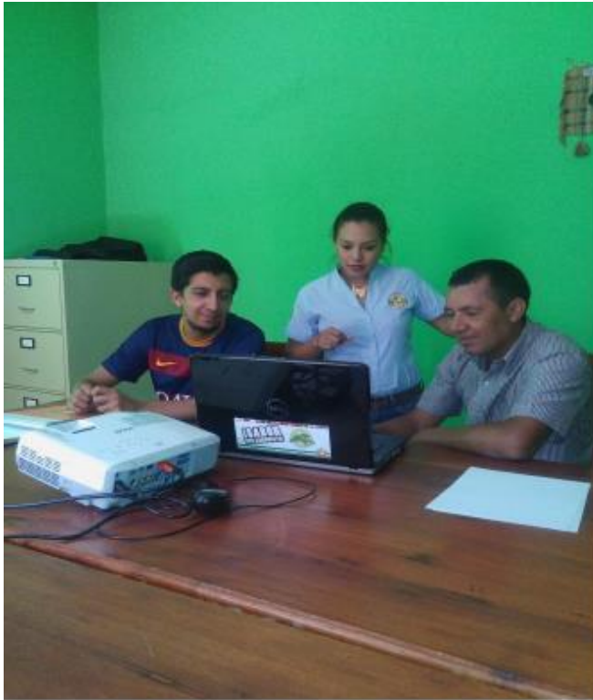
Foto 4. Capacitación de Gestión y herramienta para exportar