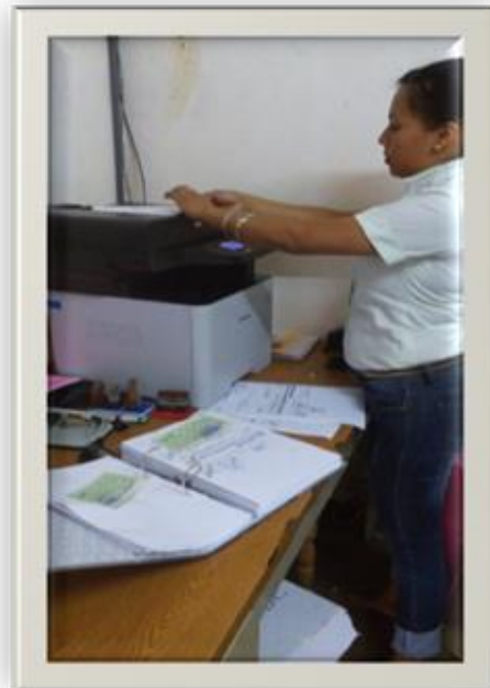
Fotos 3. Copias para expedientes