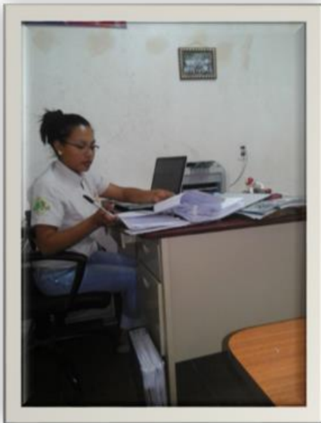
Foto 2. Actualización de expediente