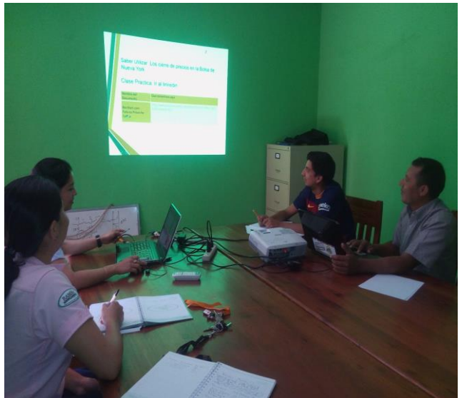
Foto 5. Capacitación de Gestión y herramienta para exportar